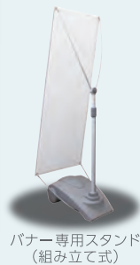
バナー専用スタンド (組み立て式)