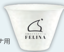
フェリーナ用 紙カップ